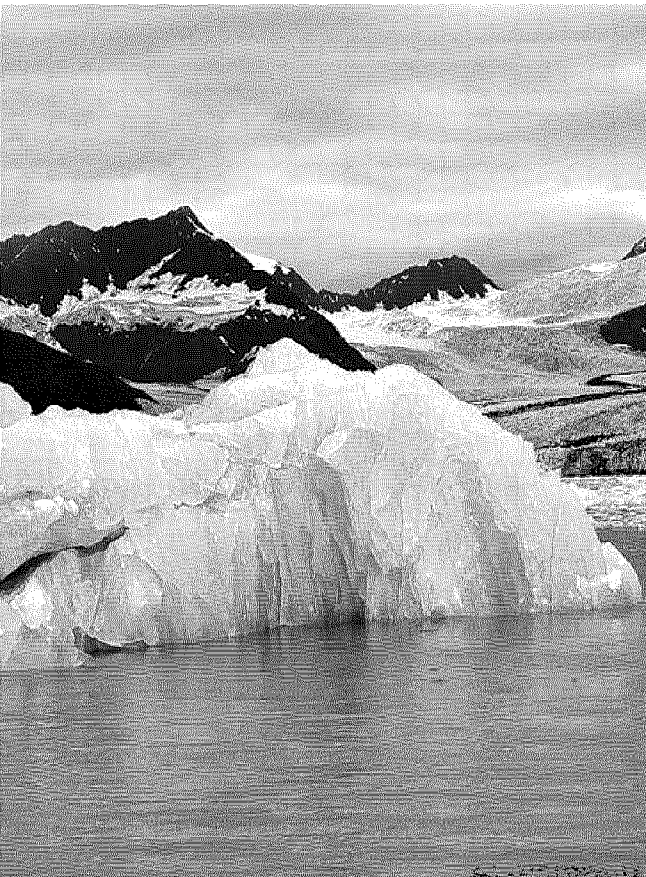
Acqua e ghiaccio: ci sarà anche uno spettacolo audiovisivo a Trieste Next