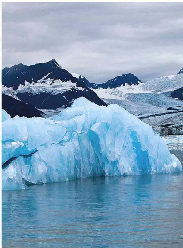
Acqua e ghiaccio: ci sarà anche uno spettacolo audiovisivo a Trieste Next